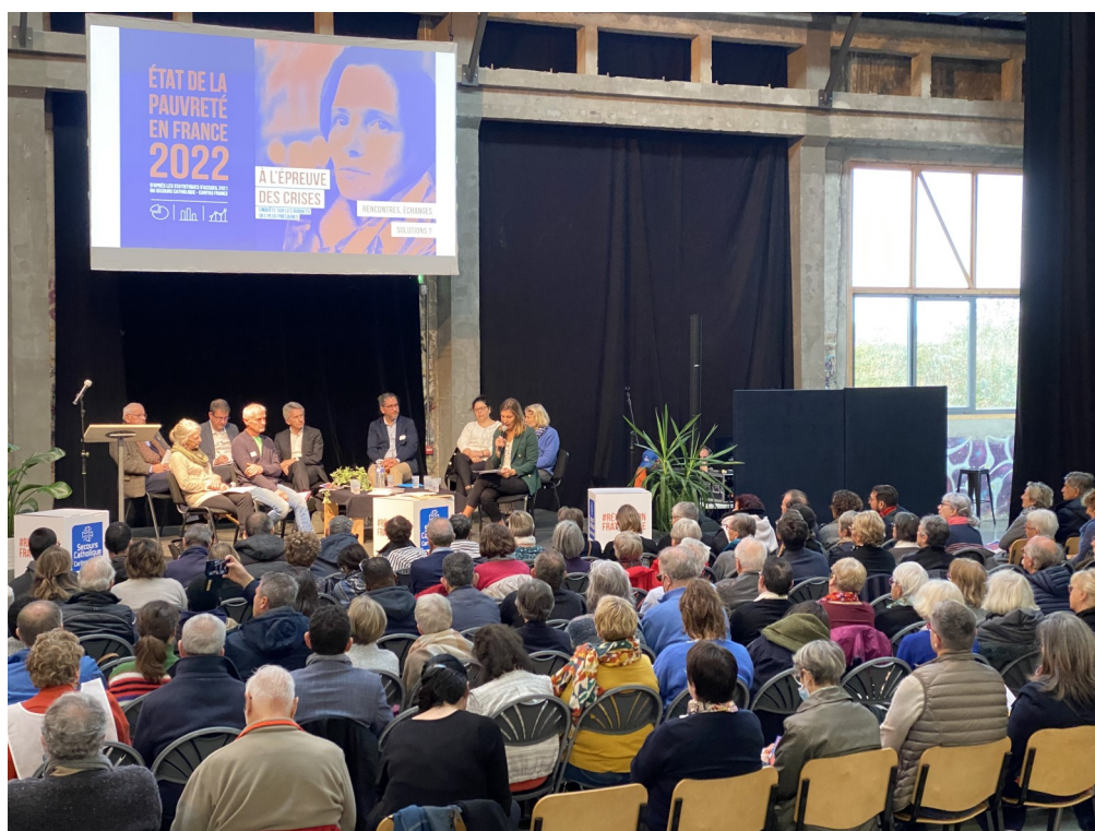
Rencontre Régionale du 17 novembre 2022 - Présentation de l'Etat de Pauvreté à Colombelles (14)

Secours Catholique - Délégation de la Manche